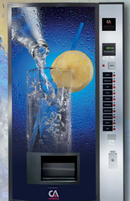
ICELAND 3280 EC (gewölbte Tür)