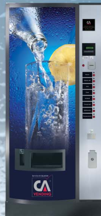
ICELAND 3185 FD (gewölbte Tür)