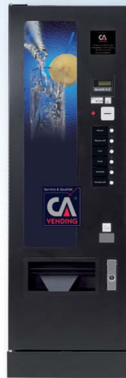
ICELAND 3158 FD (flache Tür)