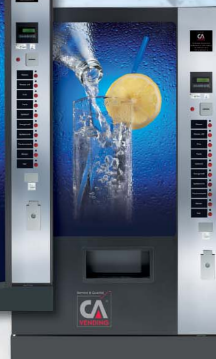
ICELAND 3230 FD