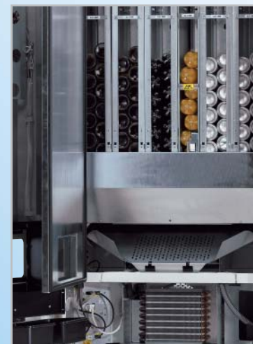
Elektronisch geregelte Hochleistungs-Einschubkühlung mit optimiertem Kühlkreislauf.

Andere Flaschenarten und -größen auf Anfrage möglich.