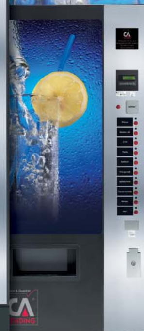
ICELAND 3230 FD