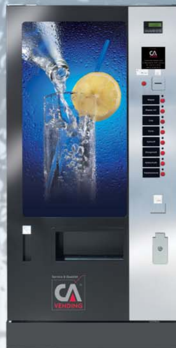
ICELAND 3170 FD (flache Tür)