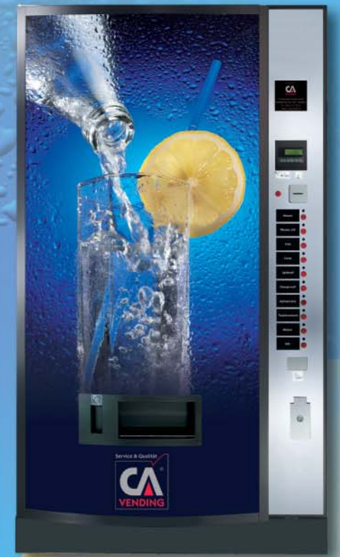
ICELAND 3270 FD (gewölbte Tür)

Für jeden Anspruch der Richtige, die ICELAND Serie umfasst sechs Kaltgetränkeautomaten, die abhängig von Aufstellort und Getränkeumsatz exakt Ihren Anforderungen gerecht werden.