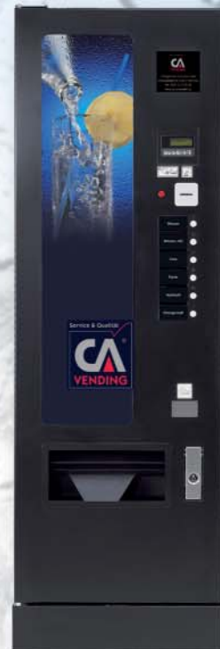
ICELAND 3158 FD (flache Tür)