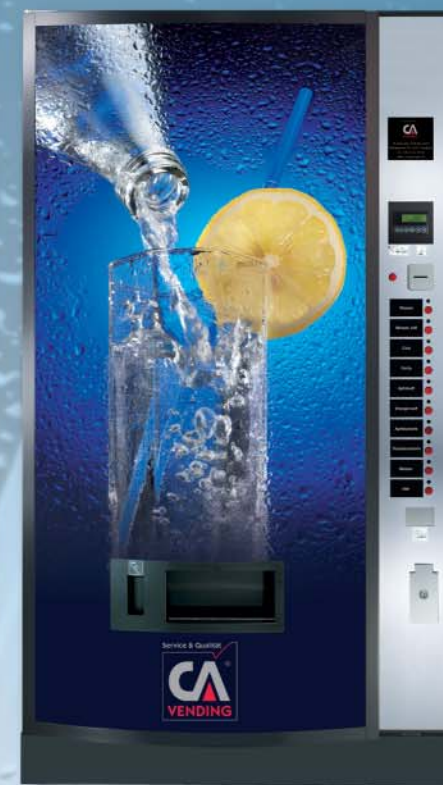
ICELAND 3270 FD (gewölbte Tür)