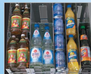
Optimale Kühlraumausnutzung und Anpassung an das Produktangebot durch variablen Einsatz von Normal- und Schmalschächten.