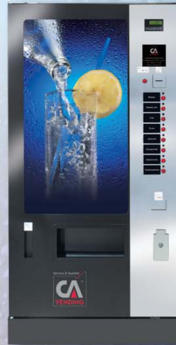
ICELAND 3170 FD (flache Tür)