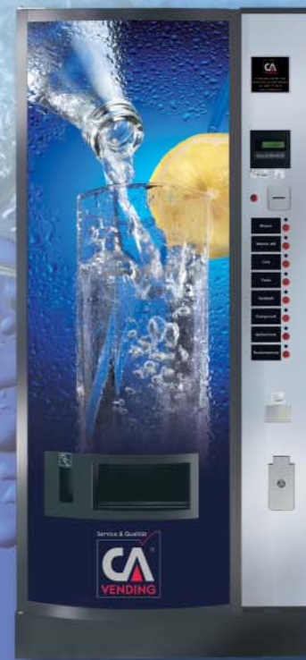
ICELAND 3185 FD (gewölbte Tür)