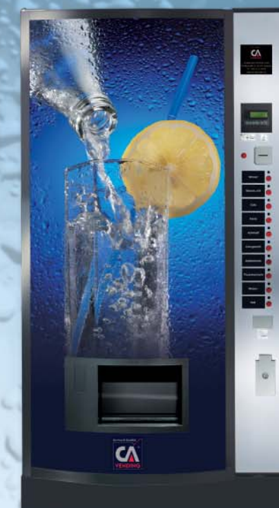
ICELAND 3280 FD (gewölbte Tür)